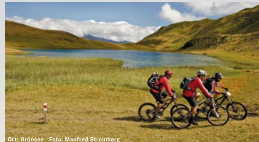
Ort: Grünsee

Die freundliche Dame am Hotel-Empfang schien uns zu durchschauen. «Mit der Gästekarte könnt ihr morgen die Bergbahnen gratis benutzen. Das Bike kommt für fünf Franken auch gleich mit», erklärte sie uns beim Bezug der Hotelzimmer. Das lassen wir uns nicht zwei Mal sagen. Den ersten kräftezehrenden Aufstieg bewältigen wir mit der Parsennbahn. Bei der Mittelstation Höhenweg ist für uns